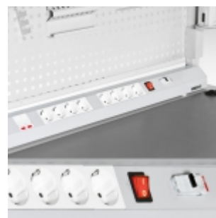
Розетка с разъемом Ethernet RJ-45, дополнительное оборудование электропанели